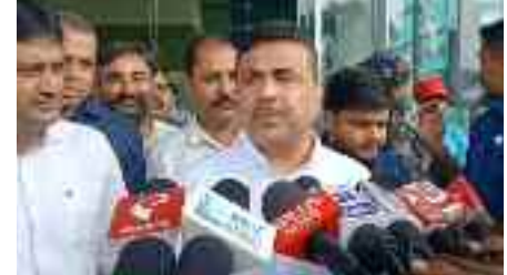
মমতা বন্দ্যোপাধ্যায়কে ভোট দেবেন না। সূত্বেভাবে নির্বাচন হলে আর হিন্দুরা ভোট দিতে পারলে এই সরকার পড়ে যাবে, কারণ এরা ভোট হতে দেয় না।

নিজস্ব প্রতিবেদন, দুর্গাপুর: বাড়খণ্ড যাওয়ার পথে দুর্গাপুরের অভ্যন্তরের কাঁচী নাজরুল ইসলাম বিমান বন্দরে বিক্ষোভের মত্ববা করলেন রাজ্যের বিরোধী দলনেতা শুভেন্দু অধিকারী।